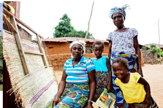
L'île de Santiago :

Santiago est très peu connu et fréquenté par les touristes. Avec sa forme particulière en guitare, c'est l'île du Cap-Vert la plus peuplée et la plus grande de l'archipel avec plus de 200 000 habitants et une superficie de 991 km 2 . On y retrouve les deux capitales, Praia et Cidade Velha (l'une économique et l'autre historique).